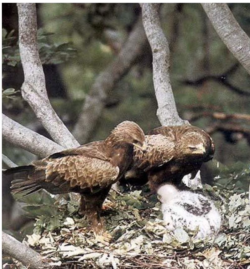
Малки кресливи орли (Aquila pomarina) в гнездо с малко.

На територията на ТП „ДГС Върбица“ е регистриран през гнездовия период в следните отдели: 124