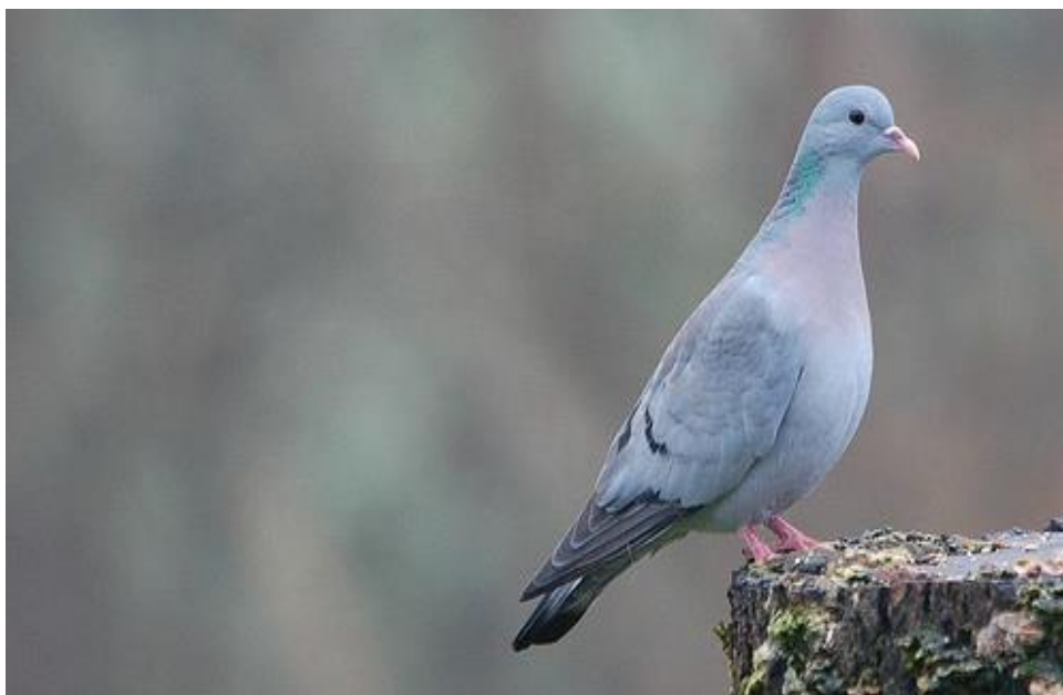
Фиг.5. Гълъб хралупар ( Columba oenas )

На територията на ТП „ДГС Върбица“ е регистриран през гнездовия период в следните отдели: 3,6,21,91,120,188,190,192.