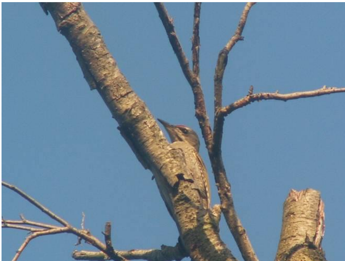
Сив кълвач ( Picus canus ), Фото: П.Шуруликов