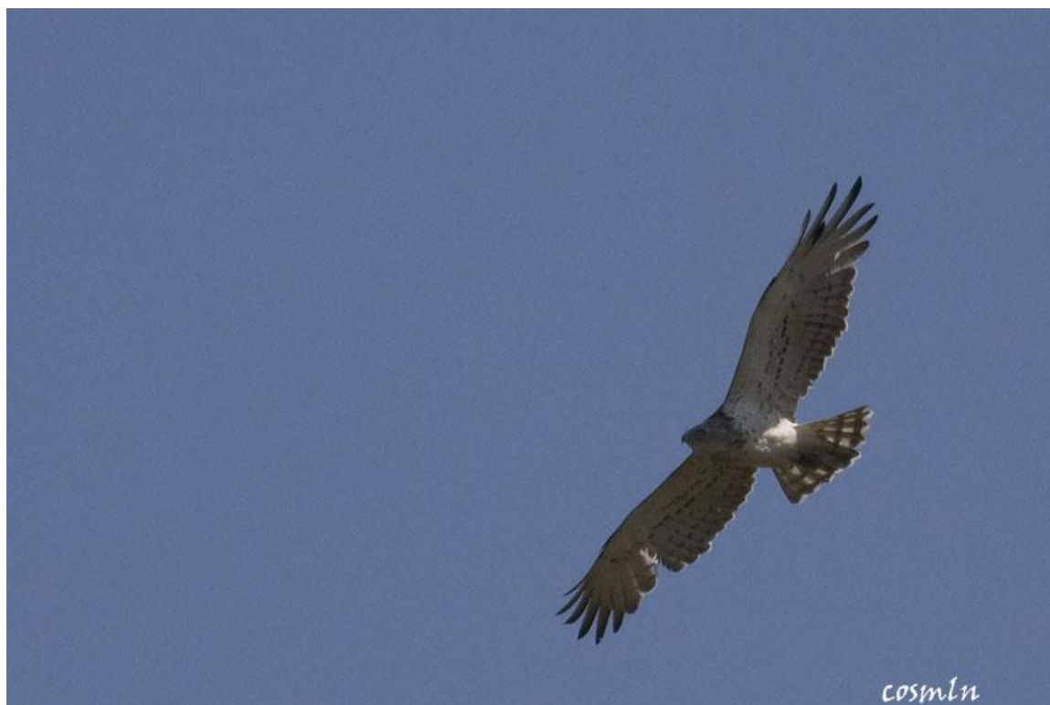
Орел змияр ( Circaetus gallicus )

На територията на ТП „ДГС Върбица” птици са установени в следните отдели /подотдели: 10,121 и 150.