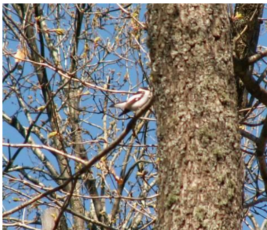
Полубеловрата мухоловка

Установен в следните отдели и подотдели: 5к, 5и, 6о, 6м, 7е, 7ж, 7з, 9м, 9л, 9р, 21, 22, 23и, 23з, 30, 39, 51, 65, 66, 71р, 72д, 72г, 75, 78, 188, 191, 197, 199, 200, 201, 203.