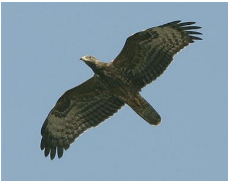
Осояд ( Pernis apivorus )

На територията на ТП „ДГС Върбица” е установен през гнездовия период в следните отдели: 3,125 и 228 .