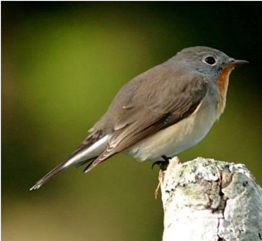
Червеногуша мухоловка ( Ficedula parva )

Много рядък вид врабчоподобна птица у нас. Включена в Приложение 1 на Директивата за птиците на ЕС и в новата Червена книга на България. Гнезди спорадично в стари букови гори, главно в Стара планина. На територията на ТП „ДГС Върбица” е установена да гнезди в следните отделени/подотдели: 14,22,63д,63е, 64, 75ж, 76и,77н,77п,124.