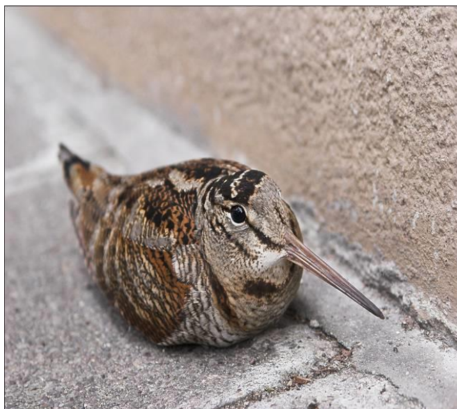
Горски бекас ( Scolopax rusticola )

На територията на ТП „ДГС Върбица” е регистриран през гнездовия период в следните отдели: 5,9,46,90,122 .